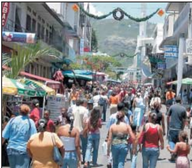
En 2004, la Réunion se classait assez loin derrière la France pour son indice de développement humain.

Toutefois, « l'évaluation du niveau de développement d'un territoire et des politiques publiques en la matière ne peut se limiter à observer les performances économiques », note Michaël Goujon, chercheur au Centre d'études et de recherches économiques et so-