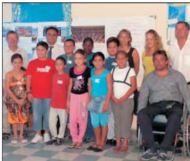
Les jeunes malentendants de l'école Louis-Fontaine vont présenter un projet de loi sur l'accessibilité des personnes aveugles.